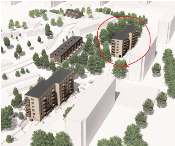
Bild 2, flygvy, placering av gruppbofastaden med röd markering.